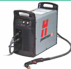
Plasma Powermax 105