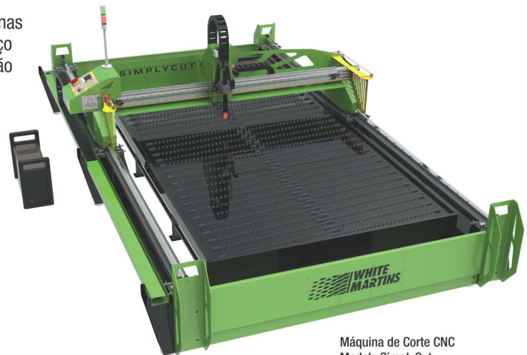
Máquina de Corte CNC Modelo SimplyCut

Nas máquinas de linha, as medidas de corte úteis variam de 1,5 à 3 m na largura e de 3 à 30 m no comprimento. Maiores larguras e comprimentos, por encomenda.