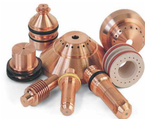
Consumíveis Plasma Originais Hypertherm

Linha completa Hypertherm de plasmas manuais e mecanizados e seus consumíveis originais, garantindo alta qualidade em sua operação de corte à plasma.